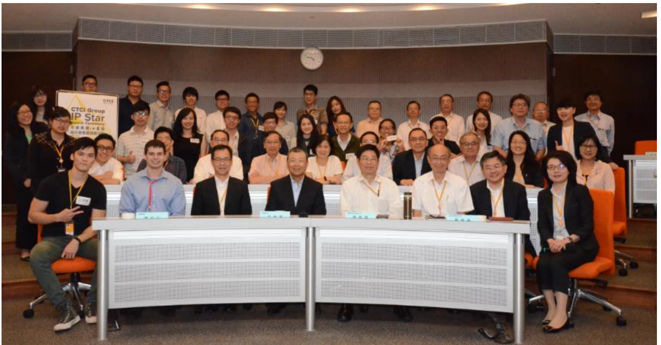
圖四、集團 IP 之星頒獎合影