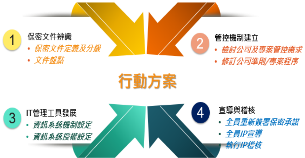
圖三、保密文件管控行動方案